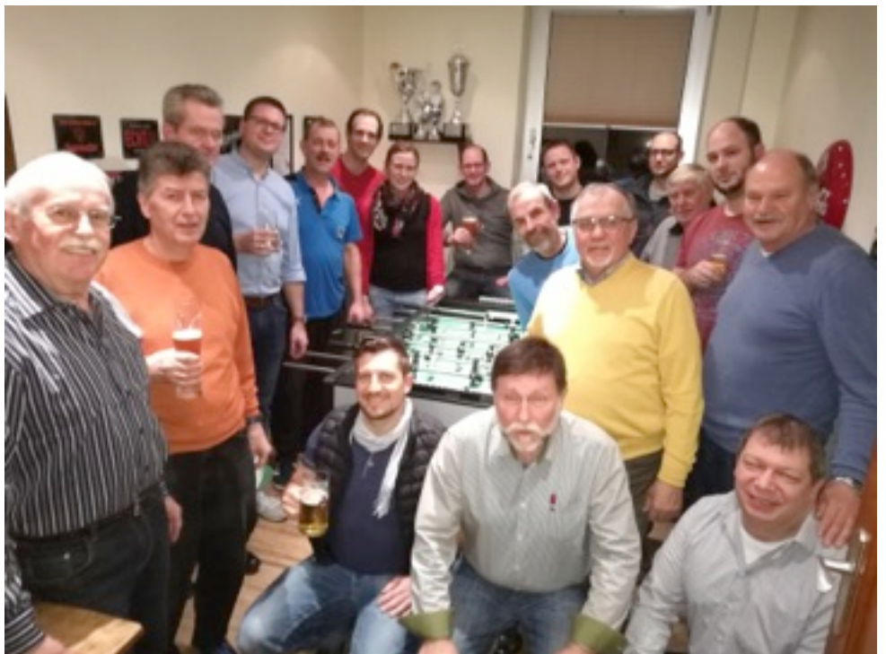
Die Teilnehmer am Kickerturnier 2018

Eine gelungene Veranstaltung die super lief. Allen Teilnehmern hat es viel Spaß gemacht. Anfang 2019 kommt es dann zur Neuauflage unter dem Motto Spaß haben, Gemeinschaft pflegen „Zerser alles im Grünen“.